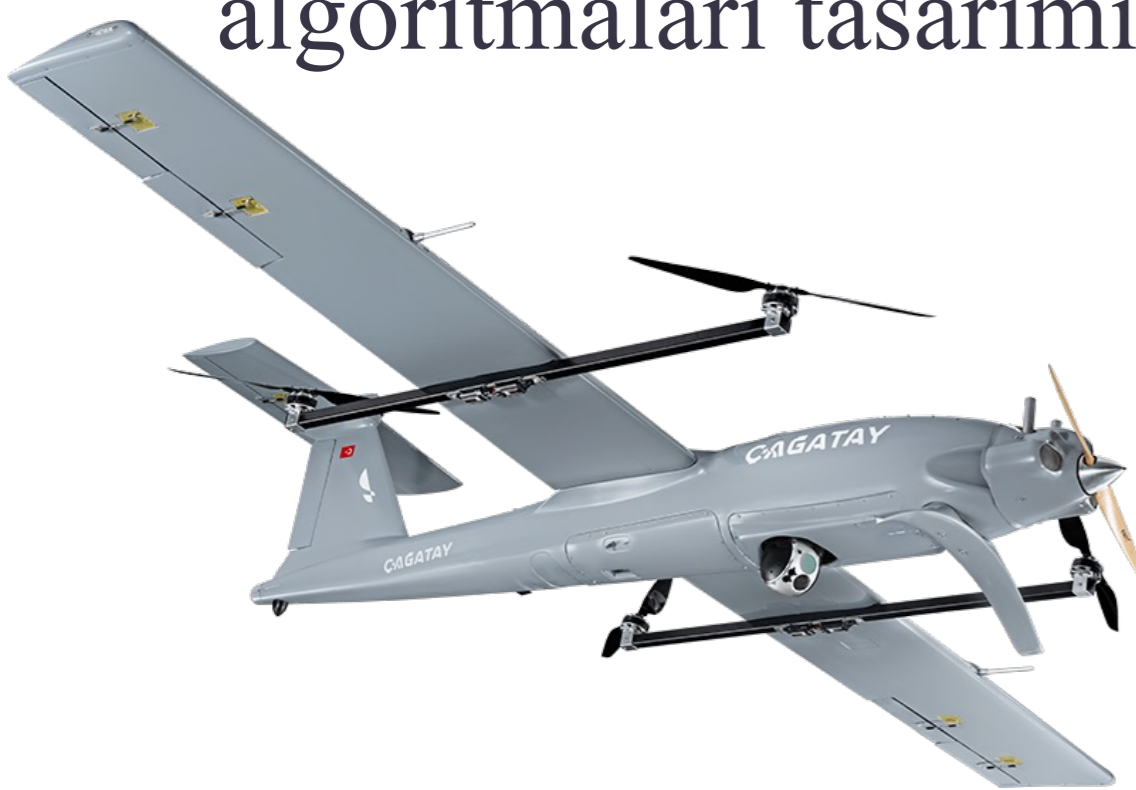
Dikine kalkan bir insansız hava aracı